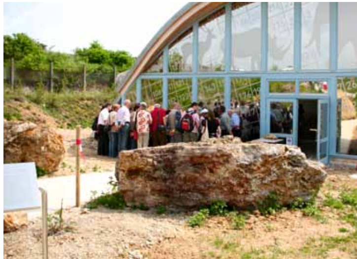
In der Ausgrabungsstätte in Bilzingsleben sind die Überreste des Steinzeitmenschen zu sehen.

In den 1970er Jahren wurde im kleinen Ort Bilzingsleben ein sensationeller Fund ausgegraben. Die Überreste eines 370.000 Jahre alten Steinzeitmenschen können seit 2009 in der Ausgrabungsstätte im ehemaligen Travertin-Steinbruch besichtigt werden. Besucher können in der „Steinrinne Bilzingsleben“ über eine Glasbrücke laufen und die Reste bewundern. Führungen mit vielen wissenswerten Informationen werden angeboten.