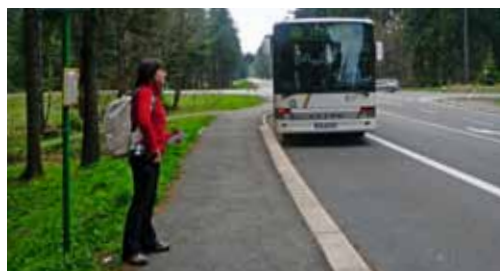
Die IOV-Linie 300 fährt zwischen Suhl und Ilmenau über die Haltestelle Rennsteigkreuzung.

Unter dem Namen RennsteigBus geben fünf Busunternehmen und die Marketingkooperation Bus Thüringen e.V. mit zwei großformatigen Faltblättern einen Überblick über Linienangebote im Thüringer Wald. Auf einer Nord-Süd-Linie