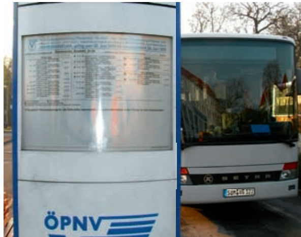
Ab 27. Juni 2010 verkehren die Linienbusse nach neuem Fahrplan.

Zusätzliche Fahrt montags bis freitags um 4.22 Uhr von Sömmerda, Busbahnhof nach Bilzingsleben. Die Fahrten von Sömmerda bzw. Kindelbrück in Richtung Bilzingsleben / Kannawurf montags bis freitags zwischen 6.00 und 7.30 Uhr verkehren teilweise zu veränderten Zeiten und mit verändertem Fahrtverlauf. Zusätzliche Fahrt montags bis freitags um 21.15 Uhr von Kindelbrück, Rathaus nach Sömmerda. Zusätzliche Fahrt samstags und sonntags um 19.39 Uhr von Bilzingsleben nach Sömmerda.