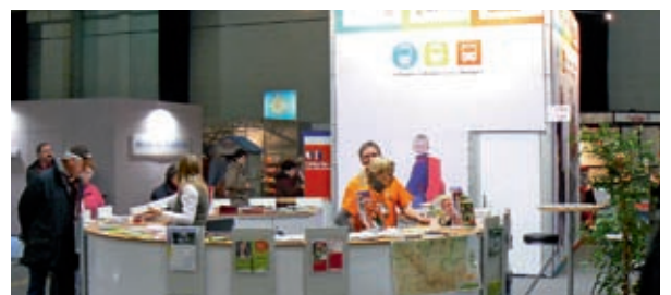
Gemeinsamer Messeauftritt mit MBT, NVS, VMT

stand unter dem Motto „Mit Bussen und Bahnen mobil in Thüringen“. Das dort vorgestellte Angebot von Bussen und Bahnen, das Informationsmaterial und die vielen Fragen und Antworten am Gemeinschaftsstand bestätigten, dass der ÖPNV in Thüringen für die Bürger unverzichtbar ist. ■