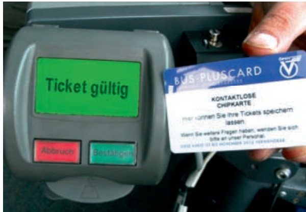
Auf der Bus-Pluscard können verschiedene Fahrscheinarten aufgespeichert werden.

Schon können Sie auf der gewählten Strecke losfahren, umsteigen, weiterfahren, wann immer Sie wollen.