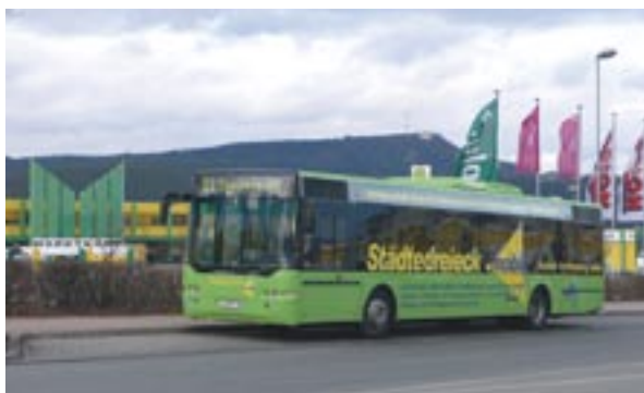
Das Saalfelder Gewerbegebiet „Am Mittleren Watzenbach“ ist mit den Städtedreieck-mobil- Linien S1, S2, B und C gut erreichbar.

► An der Bushaltestelle im Gewerbegebiet Saalfeld warten an diesem Nachmittag etwa 15 Fahrgäste. Die meisten tragen große Einkaufstüten, sie wollen nach Hause fahren.