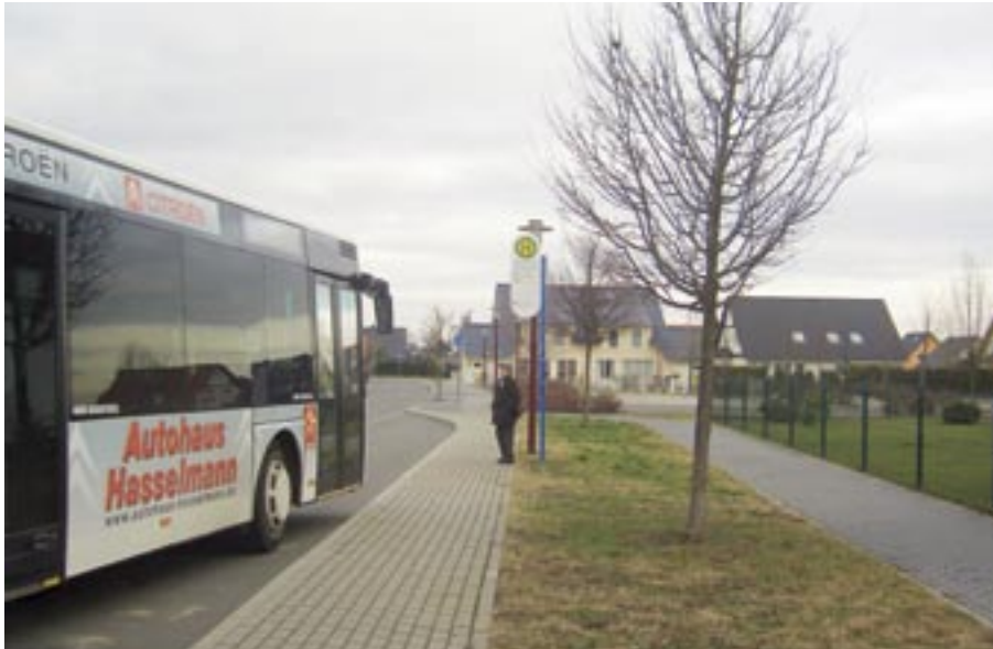
Abfahrt am Ulmenweg ins Stadtzentrum von Sömmerda.

Fünfmal täglich bis zum Busbahnhof Im aktuellen Nahverkehrsplan für den Landkreis Sömmerda gibt es dazu einen Vorschlag, der jetzt umgesetzt worden ist. Kurzfristig verständigten sich die Kreisverwaltung