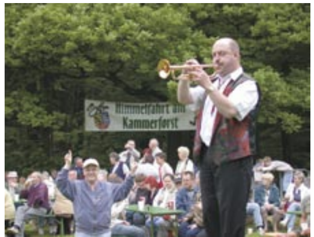
Himmelfahrt feiern in Kammerforst bei Burgwenden.

gibt es einen Flohmarkt, für die Erwachsenen wird eine Modenschau vorbereitet. Blankenhain ist mit den Linien 221 und 236 gut aus Weimar, Bad Berka und Kranichfeld erreichbar.