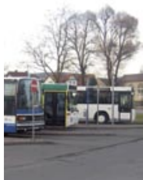
Garantiert umsteigen. Am Busbahnhof in Bad Berka.

mäßig um 7.30 Uhr abfährt. Kleine Zeitverzögerungen da oder dort und schon geht der Überblick beim Umsteigen verloren. In Bad Berka werden noch in diesem Jahr moderne Haltestellenanzeigen installiert, die minutengenau über die tatsächlichen Abfahrtszeiten, die sogenannte Ist-Zeit, informieren. Dann verkündet