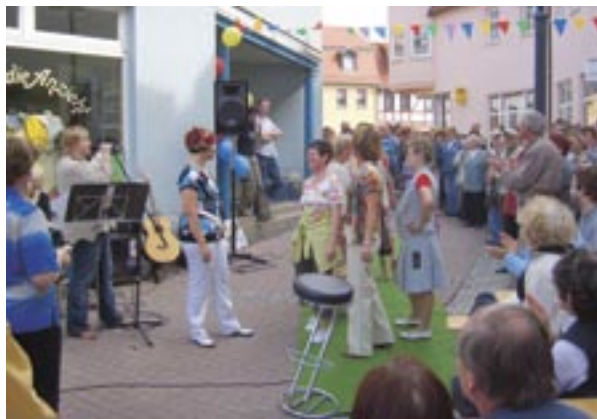
Das Frühlingsfest in Blankenhain lockt am 26. April.

26.04.2008, 10-18 Uhr Das Frühlingsfest in der Innenstadt entlang der Sophienstraße und -passage hat noch eine junge Tradition. Für die Kinder